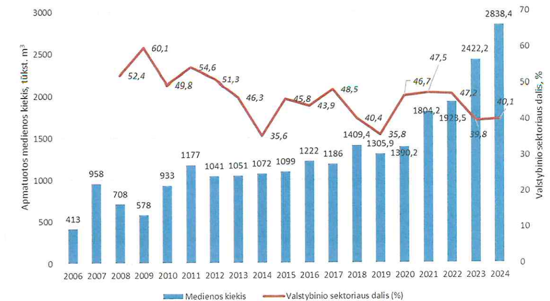
1 pav. LNMMA apmatuotos apvaliosios medienos kiekiai 2006-2024 metais.

2024 m. Valstybinio sektoriaus apmatuotos medienos kiekis sudarė 40,1% nuo viso bendro kiekio ir lyginant su 2023 m. kiekiu praktiškai išliko stabilus (skirtumas 0,3%). Valstybinio sektoriaus apmatuotos medienos santykis su bendru apmatuotu kiekiu pagal atskirus metus pateiktas 1 pav.